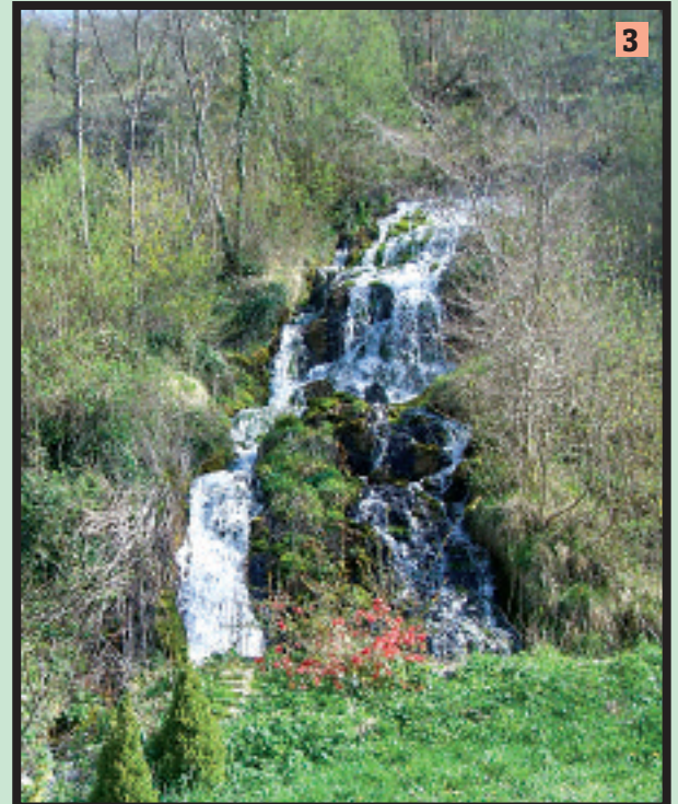
Alcune note sono prese da «Amico Castello, origini, storia, turismo e immagini di Castelsantangelo sul Nera» di Rodolfo Falconi, 1986; «Castelsantangelo sul Nera», a cura della Pro-Loce delle Valli Castellane.

Santa Messa festiva nella zona proposta: chiesa di San Sebastiano, ore 10.