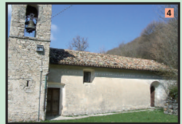
Alcune note sono prese da «Amico Castello, origini, storia, turismo e immagini di Castelsantangelo sul Nera» di Rodolfo Falconi, 1986; «Castelsantangelo sul Nera», a cura della Pro-Loce delle Valli Castellane.

Ristorante consigliato: «L'Erborista», telefono 0737 98134.